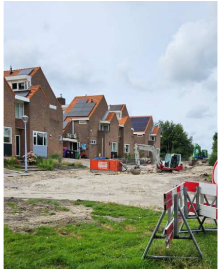
WERK AAN DE WEG BIJ HOOFDWEGWESTZIJDE